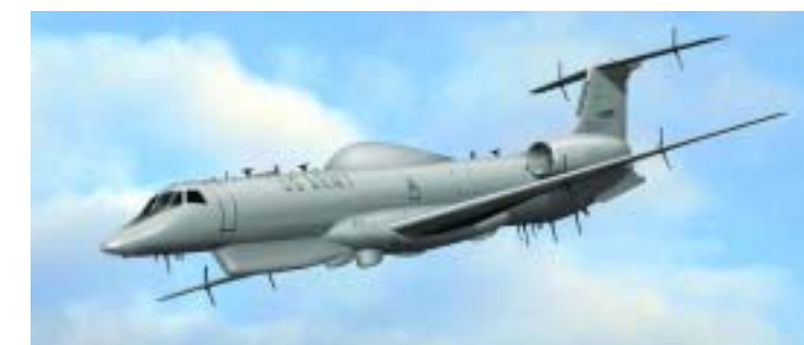
El avión de Sensores Comunes aereos será construido en Cecil Commerce Center en Jacksonville.

(homeland). El proyecto representa otro movimiento significativo de una corporación a Jacksonville para el desarrollo de Cecil Commerce Center.