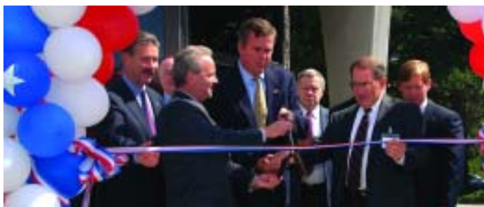
El Gobernador George Bush y el Alcalde de Jacksonville John Peyton se reunieron con el presidente de Kaman Aerospace Corporation Joseph Lubenstein y el equipo ejecutivo de Kaman para el corte de la cinta de inauguración de las nuevas facilidades en Jacksonville.

La compañía Aeroespacial Kaman abrió sus nuevas instalaciones de 248,000 pies cuadrados en